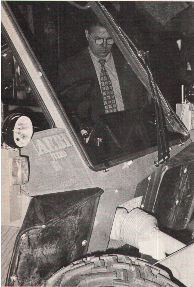
Prägnantes Designbild der Schweiz: der «Hang-Geräteträger»