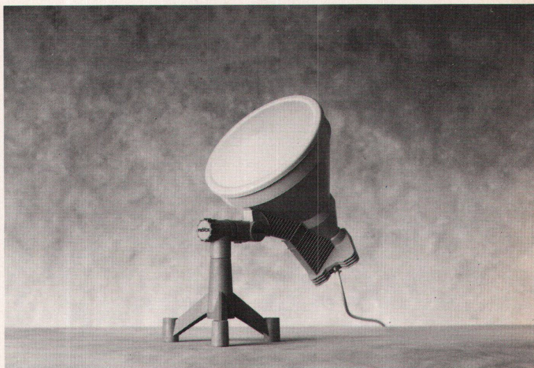
Neue Satellitenantenne IC-1000

der High-Power-Satelliten TV-Sat oder TDF bestimmt. Mit dem Modell AS-2000 (Durchmesser 34 Zentimeter) können die Medium-Power-Satelliten Astra 1a und 1b mit ihren insgesamt 32 TV-Programmen angezapft werden. Ausserdem: «Das unauffällige Aussehen prädestiniert die Kompaktantenne für Fälle, wo Nachbarn oder Gemeindebehörden Einsprache gegen die Aufstellung einer normalgrossen Antenne erheben könnten.» ■