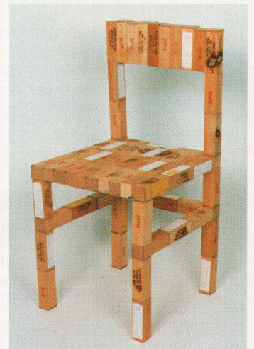
Der «freiburger stuhl-stuhl» besteht aus kleinen Holzbehältern, die für Laboruntersuchungen des Stuhlgangs von Patienten in Spitälern verwendet wurden

Info: galerie blau, Dorfstrasse 8, D-79280 Freiburg, 0049 / 761 40 78 98.