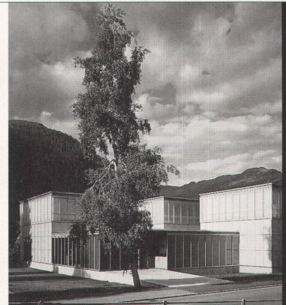
Projekt: Ernst Ludwig Kirchler Museum Architekten: Gigen & Guyer, Zürich

Ästhetik, Wirtschaftlichkeit und bauphysikalische Anforderungen in Einklang zu bringen, ist das Ergebnis ausgereifter Konstruktionen. Qualitätsbewusstsein und partnerschaftliche Zusammenarbeit sind nur einige der Voraussetzungen für ein gutes Gelingen in dieser vielfältigen Branche.