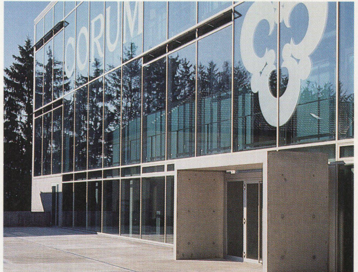
Das neue Corum Gebäude in La Chaux-de-Fonds von Althammer und Hochuli