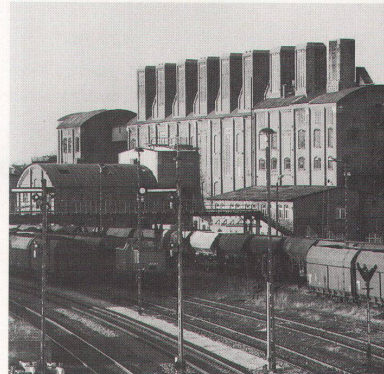
Die Brikettfabrik «Marie» in Deuben

Christian Bedeschinski, Ein-Blicke. Industriekultur im Osten Deutschlands. Haude & Spener Verlag, Berlin 1995. 59,60 Franken.