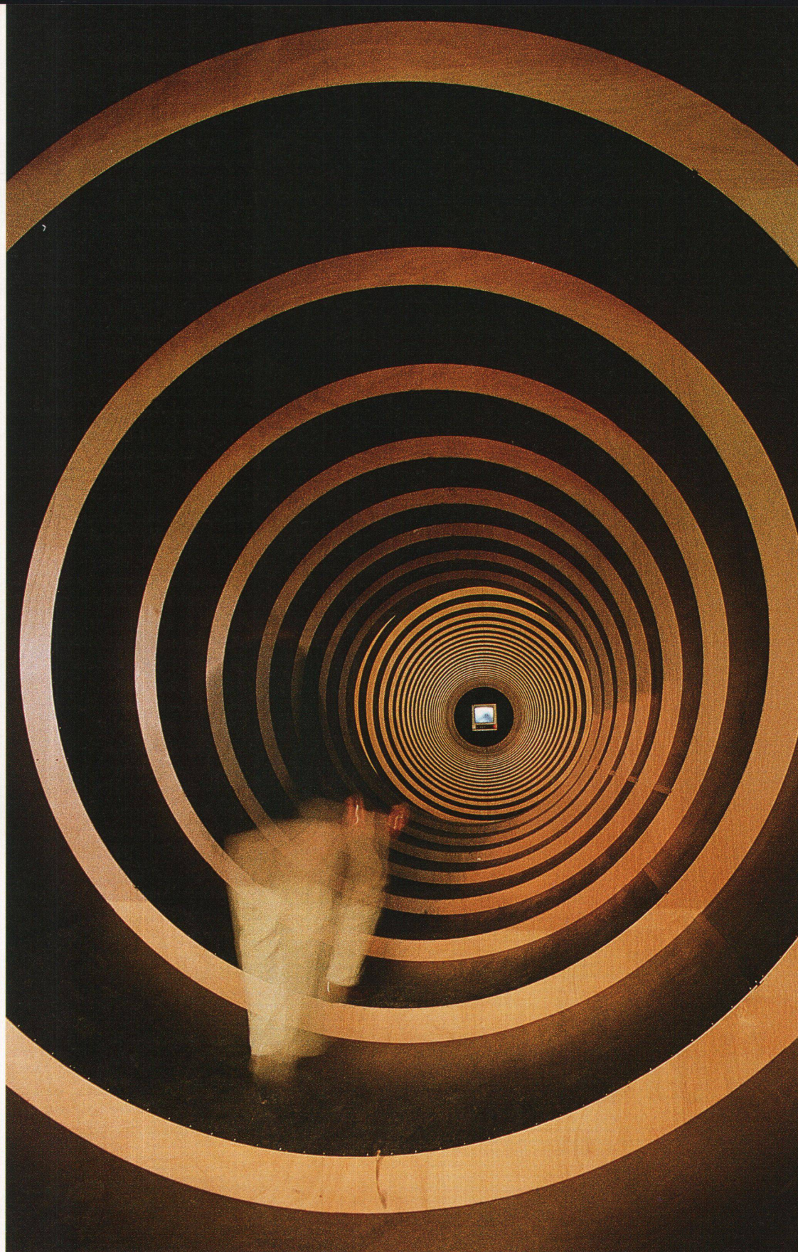
Eingang zur Ausstellung «Zeitreise» (1993)

Dezidiert auf Brüche und damit auf Irritation ausgerichtet war die Ausstellung «Schweizerwelt» (1991). Aus