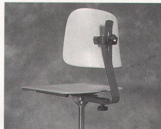
Dynasit-Class: Dank dem patentierten Kippmechanismus sitzen die Schülerinnen und Schüler in jeder Lage ergonomisch richtig.