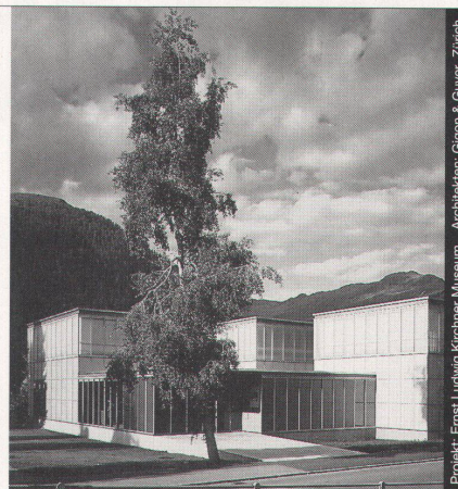
Projekt: Ernst Ludwig Kirchler Museum Architekten: Gligon & Guyer, Zürich

Ästhetik, Wirtschaftlichkeit und bauphysikalische Anforderungen in Einklang zu bringen, ist das Ergebnis ausgereifter Konstruktionen. Qualitätsbewusstsein und partnerschaftliche Zusammenarbeit sind nur einige der Voraussetzungen für ein gutes Gelingen in dieser vielfältigen Branche.