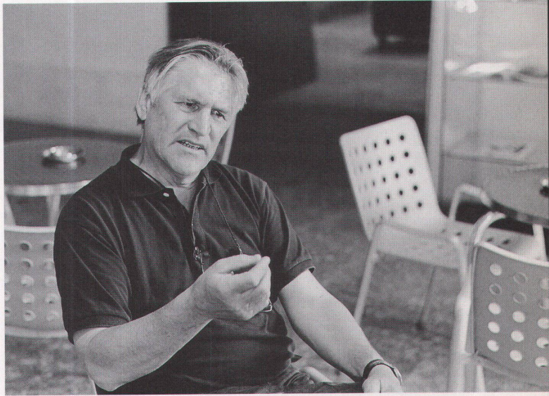
... Weiterbildung für Fachleute wie auch für Laien

im Pool der Administration. Wir haben nur zweieinhalb Stellen im Design Center, deshalb ist es angenehm, wenn nun das Sekretariat der Stiftung hierher kommt: Das gibt uns eine gewisse Entlastung.