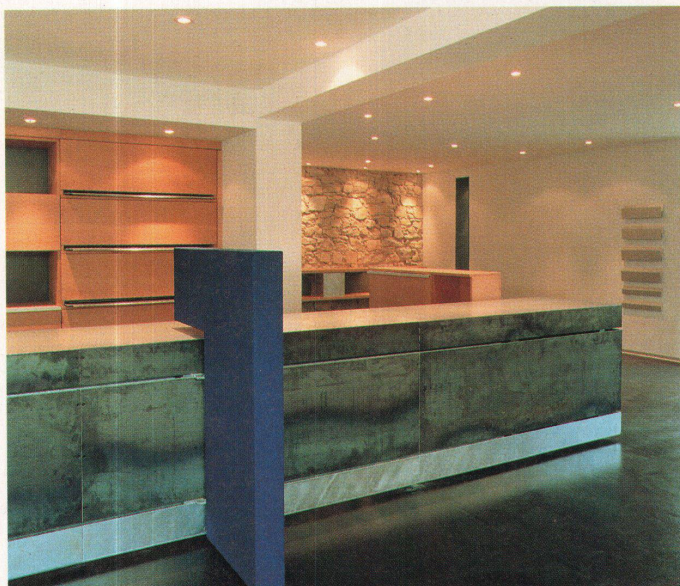
Mit dem L-förmigen blauen Aufsatz wird die Eisentheke unterteilt