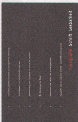
Typografiegeschichte in sechs Kapiteln von Hans Rudolf Bosshard