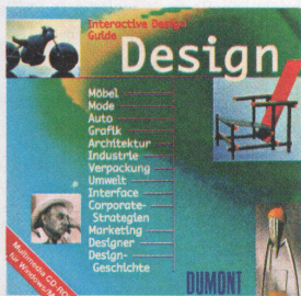
Der Design-Führer auf CD-ROM aus dem DuMont-Verlag

R. Rigling AG Leutschenbachstrasse 44 8050 Zürich Oerlikon Telefon 01 301 22 30 Telefax 01 301 14 11