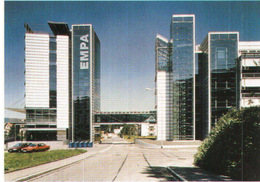
Bilder: Markus Fischer