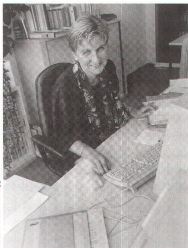
Bilder: Alexander Egger