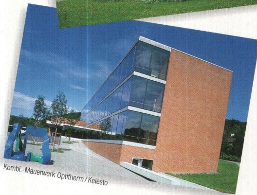
Kombi.-Mauerwerk Optitherm / Kelesto

Das Prädikat wertvoll für Objekt und Material. Die Kelesto-Linie der Keller AG Ziegeleien für innovative Architektur in Sichtstein und Klinker.