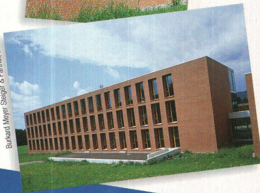
Burkard Meyer Steiger & Partner, Baden