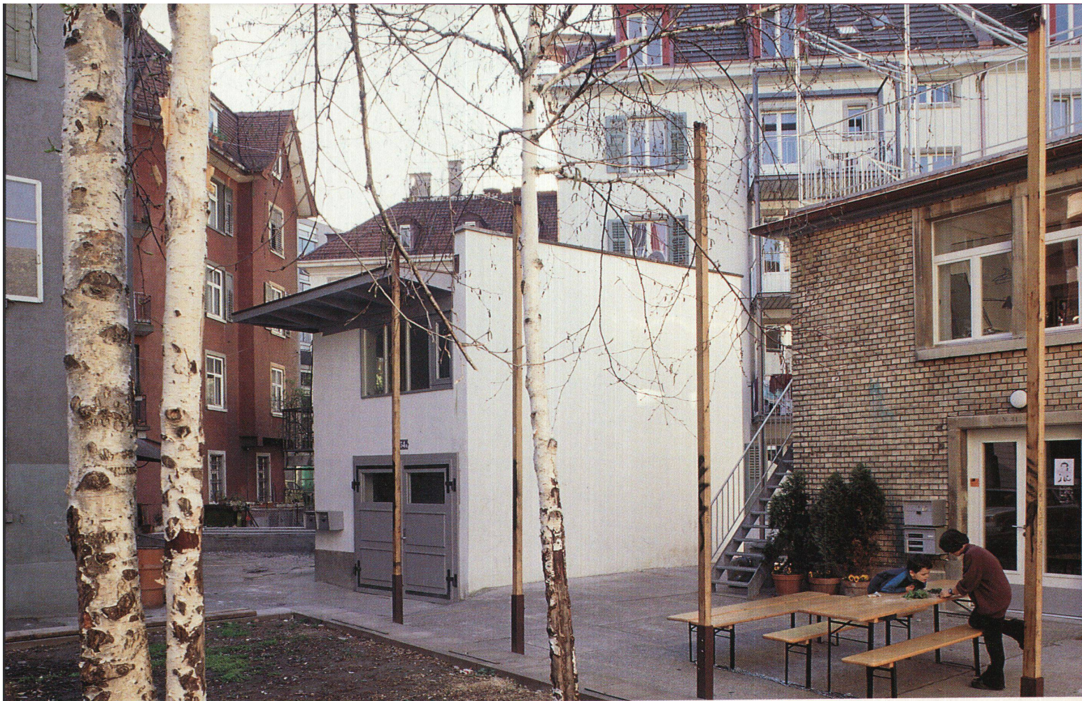
Das «Dreieck». Zwölf Häuser mit Baujahr 1877 bis 1913 um einen dreieckigen Hof gruppiert. Die Sanierung und Renovation der ersten Etappe ist seit diesem Frühling abgeschlossen

rück. 1984 wurde ein Häuserblock am Stauffacher, dem Tor zu Aussersihl, besetzt. Der Teil der zürcherischen Bewegung um 1980, der nicht in renommierten Werbebüros oder auf dem Platzspitz gelandet war, verteidigte seinen Lebensraum, und dies hiess im spekulativen Klima der achtziger Jahre das Dach über dem Kopf. 1986 tauchte für das geforderte Dach über dem Kopf der seltsame Name «Karthago» auf. Er war Programm. Nicht «Atlantis» oder «Utopia» forderten die Besetzer, sondern das, was im Hier und Jetzt im Schatten der Mächtigen möglich war – immer mitgedacht die Möglichkeit des Scheiterns. Karthago am Stauffacher hiess: ein Grosshaushalt von hundert Personen, Windräder auf begrünten Dächern, Gemeinschaftsbad und -küche. «Karthago» am Stauffacher konnte gegen die Kräfte der expandierende City nicht standhalten. 1990 liessen die Besitzer die Häuser räumen und abreißen. Doch die Forderung nach einem Experimentierfeld für neue Formen des sozialen und ökologischen Zusammenlebens blieb bestehen. Anfang der neunziger Jahre bot die Stadt Zürich eine Parzelle im Quartier Altstetten an, auf der die «Karthager» ihre Ideen in einen Neubau am Stadtrand für vierzig Personen hätten gieszen können. Die