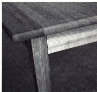
Holz durch und durch – «Anna» besteht aus massiver Buche

nisch-ökologischen Nebelschwaden verziehen sich, wenn man das Möbel noch einmal von der Produktionsseite her betrachtet. «Anna» verschweigt nicht, woher sie kommt. Das Hirn eines Computers hat sie vorformatiert. Der Bauch einer hochmodernen Fabrik hat sie geboren. Die Blindnavigation des zeitgenössischen Marketings hat sie auf die Welt gestellt. Wenn hier der individuelle Bezug zum Thema wird, dann radikal jenseits irgendeiner tradi-