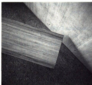
Der Computer realisiert die Illusion eines Einzelstücks

stimmiger Slogan, gerade in seiner verdeckten Abgründigkeit. «Anna», so sagen die Verkaufszahlen, hat ihren Platz gerade so gut in der Stadt wie auf dem Land. Das Holz ist die Barrikade, die wohlgeformte Scheiterbeige, mit welcher die Gemütlichen unter den Städtern ihre Wände von innen her schützen und stützen. Denn Holz ist Interior im innerlichsten Sinn des Worts, bis innen hart, bis innen stark, bis innen wahr, bis innen ökologisch, bis ganz innen absolut sich selbst. Natur ist darin gerettet wie ein Wal vor den Harpunen der Exterieurs dieser verkommenen Welt. Aussen: Leimkocherei, Etikettenschwinderei, Spanplatten-Billigbretterbude. Innen: Wir und das gute Möbel und sonst gar nichts.