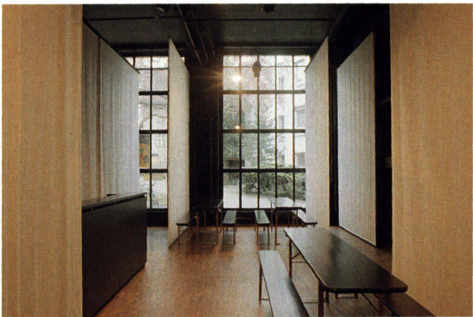
Mit an Soffitten erinnernde Stoffbahnen lässt sich der Theaterraum unterteilen