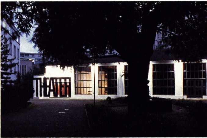
Der idyllische Hof mit grossem Baum