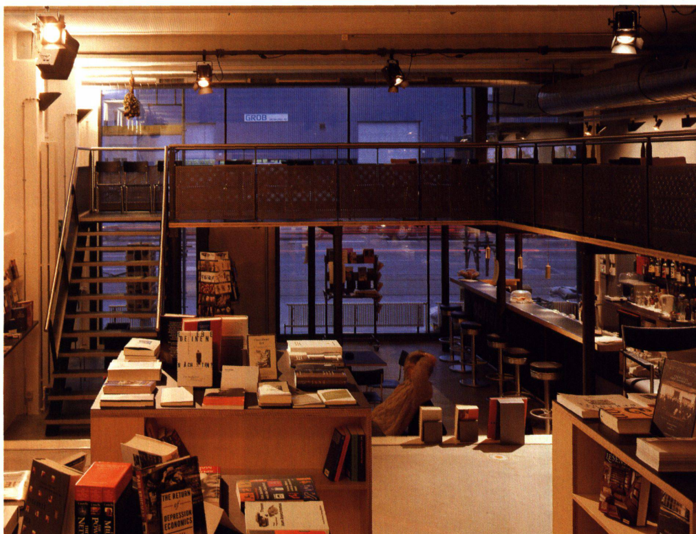
Bilder: Walter Mair