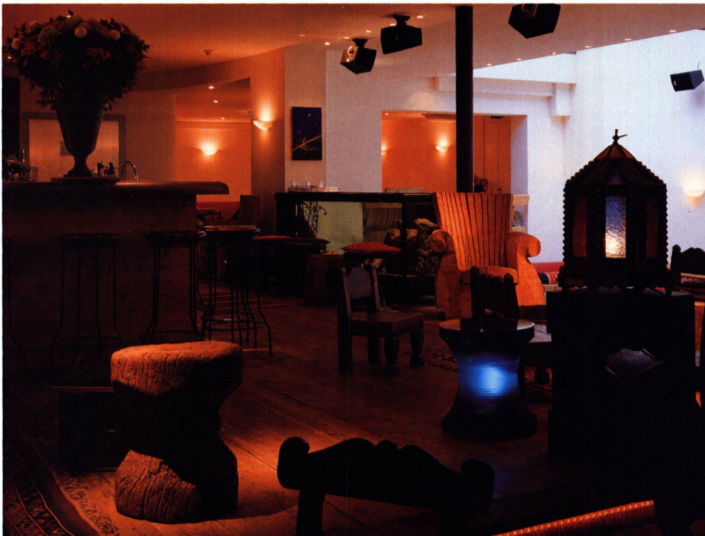
«Kaufleuten Lounge» Talacker 34, 8001 Zürich 01 / 225 33 66 (tägl. 18.30–2 Uhr)