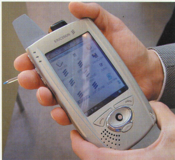
Videos, Internet, Fax und Telefon, das alles steckt in den Handys der Zukunft

Hochparterre 5/2000 erscheint am 10. Mai.