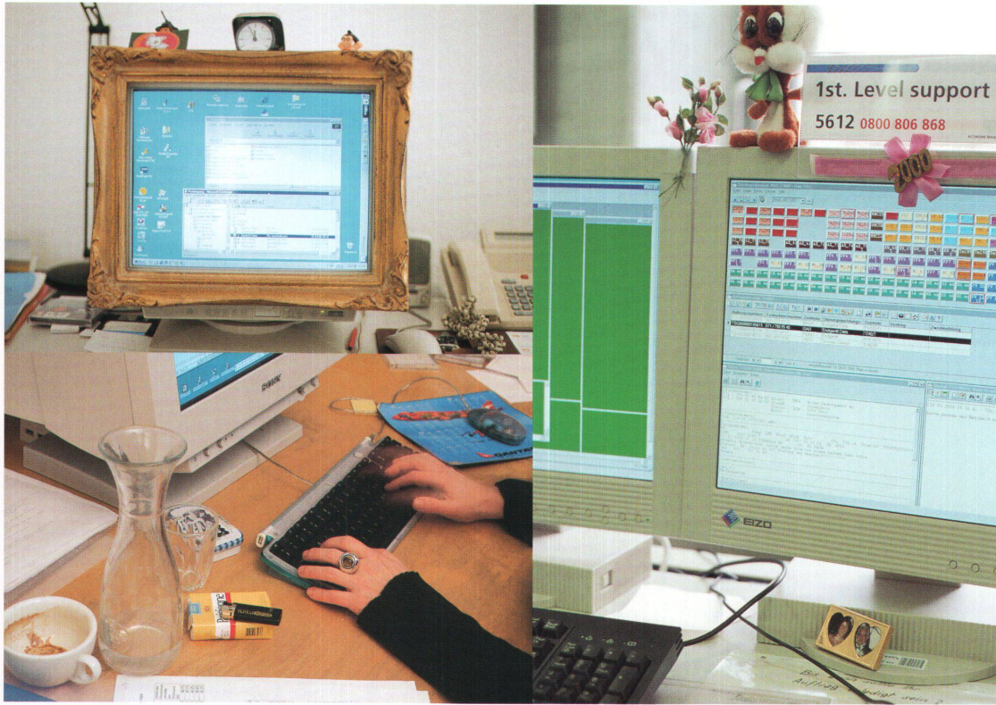
My office is my castle. Mit Fantasie und Ironie setzen wir dem Computergrau eine persönliche Note entgegen. Links oben: Museum für Kommunikation, Bern, Bildarchivar unten: Grafikatelier biv, Zürich Rechts: Swisscom Zürich