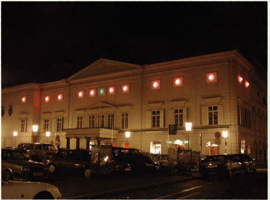
Schauspielhaus Graz: Licht-Pulsatoren übermitteln Zeichen aus dem Innern