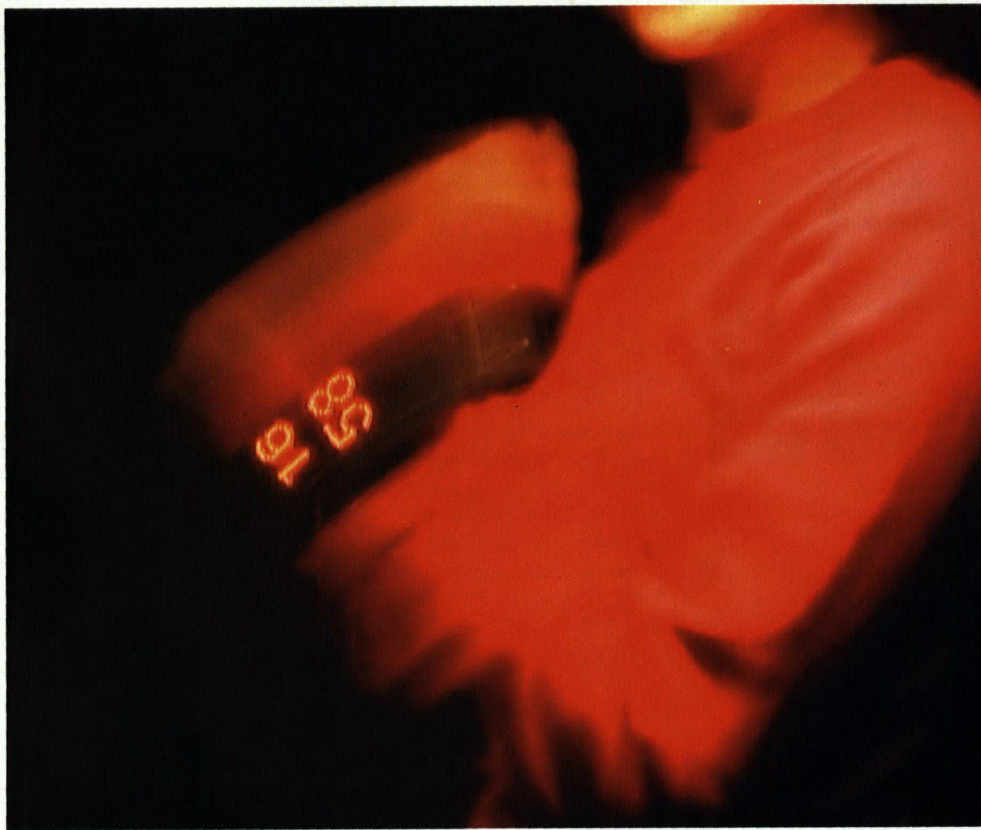
«dotwat.ch»: Durch Bewegung wird Zeit in die Luft geschrieben