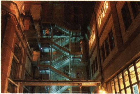
Seewasserwerk Frasnacht: Farbiges Licht orgelt über die Decke der Haupthalle. Installation Mathis/Johnson/Spiess