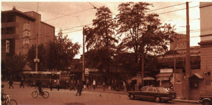
Früher fehlte dem Bahnhofplatz ein Stück der Wand