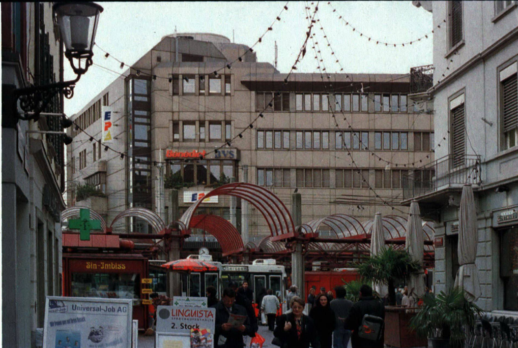
Blick aus der Achse Marktgasse/Untertor zur EPA. Da will ich nie hin, sagt der Stadtwanderer