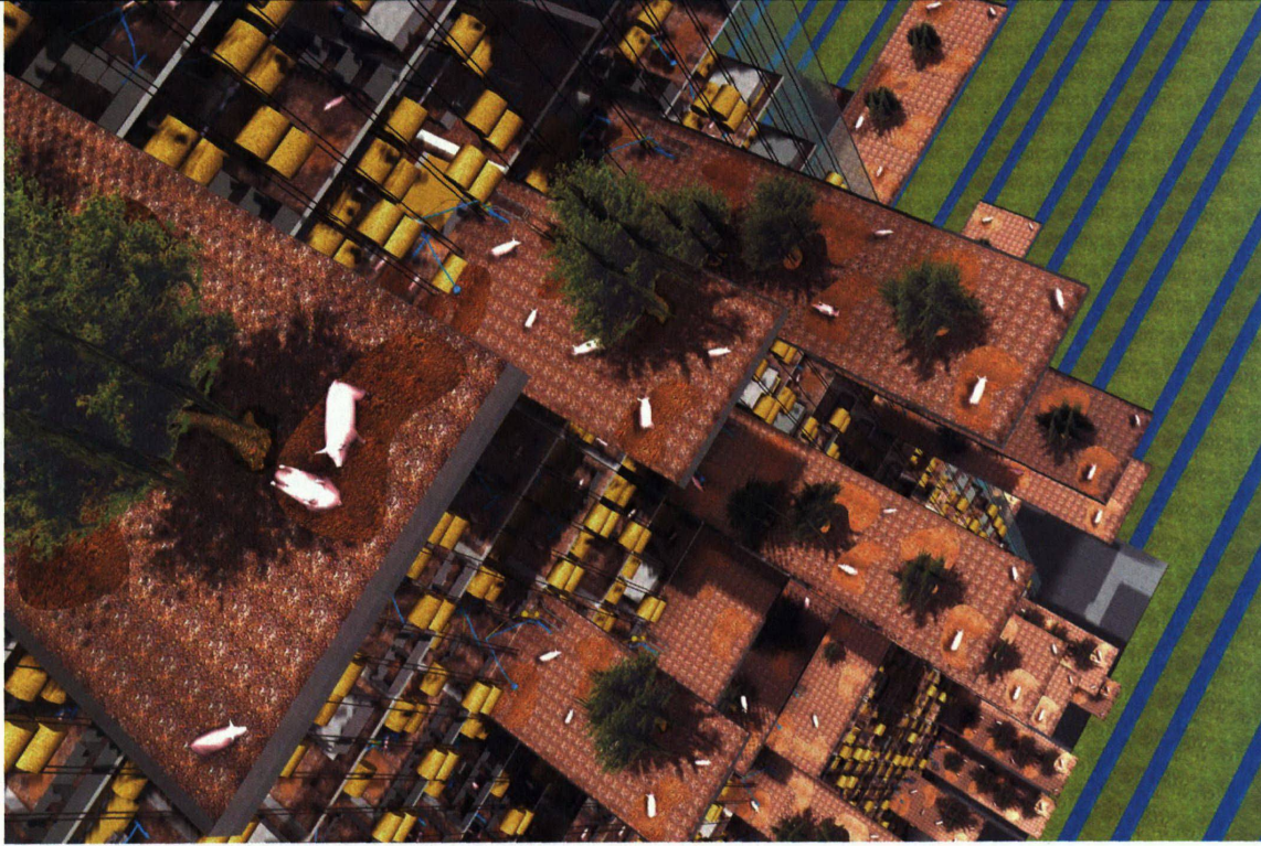
Maas in Pontresina

Der Rinderwahnsinn und die Maul- und Klauenseuche haben die Tierproduktion europaweit zuoberst auf die Traktandenliste gesetzt. Das sichert «Pig City» zusätzliche Aufmerksamkeit. Der Ausstellung im Stroom wird wiederum ein Buch folgen, ein Bestseller zweifellos. «Man muss wissen, wo es Wind hat», zitiert Winy Maas ein Sprichwort der Seefahrernation Niederlande.