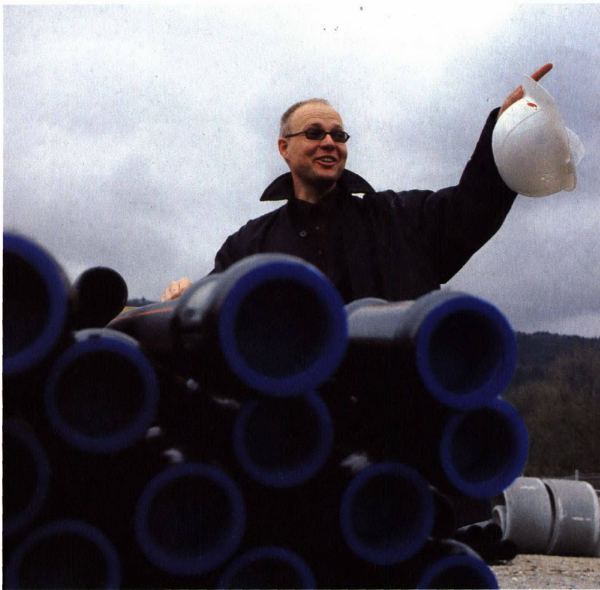
Bilder: Christine Blaser

Guido Keune leitet den Bau des Forums, der Verbindungsbrücke und der Anlagen auf dem Strandboden. Im Bildhintergrund wird in grossem Bogen die Brücke das Forum mit dem Expopark verbinden