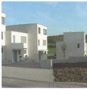
Überbauung Im Hügelacher, 2006 66

Die Siedlung liegt am Ortsrand von Rütihof und besteht aus 37 Doppel- und Reihenhäusern. Die einzelnen Gebäude sind in der Höhe und im Grundriss zueinander gestaffelt, so dass der Hang spürbar bleibt. Es präsentieren sich 7 verschiedene Häusertypen, deren Innenausbau die Eigentümer zusammen mit den Architekten gestalten konnten.