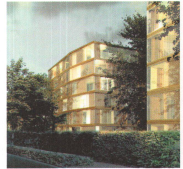
Überbauung Verenaäcker 77

Die Überbauung kommt auf den Landstreifen zwischen der Römerstrasse und der Bahnlinie zu stehen. Die Punkthäuser mit sieben Geschossen nehmen die Wohnungen auf, Bürogebäude decken den Bedarf an Dienstleistungsflächen ab. In den Wohnhäusern sind zwei, drei oder vier Wohnungen als fließende Grundrissgebilde um den zentralen Kern organisiert. Das Tragkonzept lässt grosse Freiheiten bei der Unterteilung der Grundrisse zu.