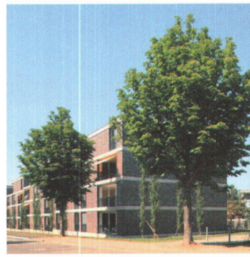
Überbauung Pilgerhof, 2006 68 67

Im Pilgerhof sind 90 Mietwohnungen in drei Häuserzeilen untergebracht. Die Gebäude mit 3 Etagen und einem Attikageschoss bilden einen dreieckigen, fast geschlossenen Innenhof mit den Hauszugängen. Gleich nebenan an der Pilgerstrasse realisierte das gleiche Architekturbüro für die Allreal ein Haus mit 49 Eigentumswohnungen mit 2 ½ bis 5 ½ Zimmern.