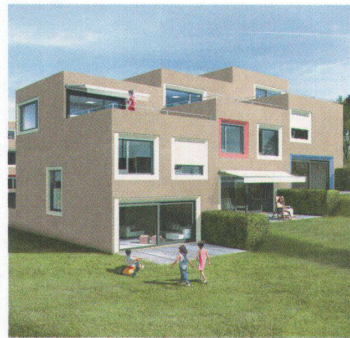
Überbauung Brennttrain, 2007 72

Die Parzelle ist das letzte nicht überbaute Grundstück auf der Allmend. In sechs quer zum Hang gestellten, abgetrepten Zeilen sind 20 Wohneinheiten untergebracht. Im Erdgeschoss liegt der durchgehende Wohnraum, im Dachgeschoss profitiert die Terrasse von der eindrucklichen Weitsicht.