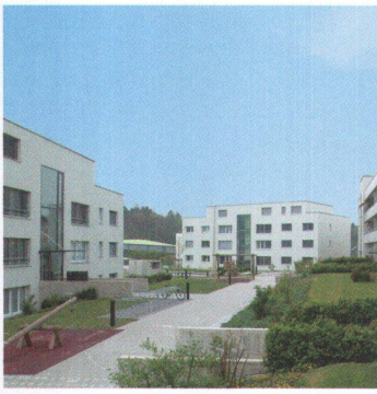
Überbauung Steiacher, 2005 63

Die Wohnüberbauung steht am Siedlungsrand von Baden-Rütihof. Die drei Blöcke gruppieren sich um eine «Spielstrasse» – Erschliessung und Spielplätze als Mittelpunkt. Die Räume der 42 Mietwohnungen erstrecken sich über die gesamte Gebäudetiefe und orientieren sich somit zweiseitig: zum lebendigen Innenhof und zur ruhigen Landseite.