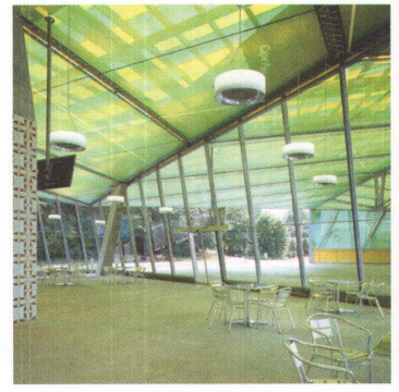
Busterminal Twerenbold, 2006 91

Das neue Terminal ergänzt einen Bau von 1989 und gibt ihm einen neuen Schwerpunkt. Ein hoch aufragendes Dach aus Stahl und PVC-Folie überdeckt den neuen Abfahrtsbereich und einen verglasten Warteraum. Auf die Unterseite des Daches ist die Europakarte gedruckt, aussen ist es mit grün-gelb gestreiftem Scobalit bedeckt.