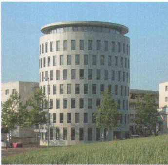
Rundbau Husmatt, 2006 92

Der Rundbau verdeutlicht den Zugang zum Stadtteil Dättwil. Er vermittelt zwischen den grossmassstäblichen Bauten des Spitalquartiers, den neuen Wohnquartieren und dem alten Dorfkern. Es ist ein Dienstleistungsgebäude, dessen Umgebung mit befestigten Plätzen und einer Baumreihe den städtischen Charakter unterstreicht.