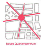
Neues Quartierszentrum am Bullingerplatz