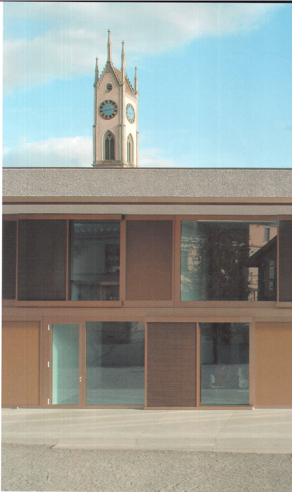
Küsnacht, Dorfstrasse: Der Neubau des Klassentraktes ergänzt ein Ensemble von Bauten aus unterschiedlichen Zeiten.