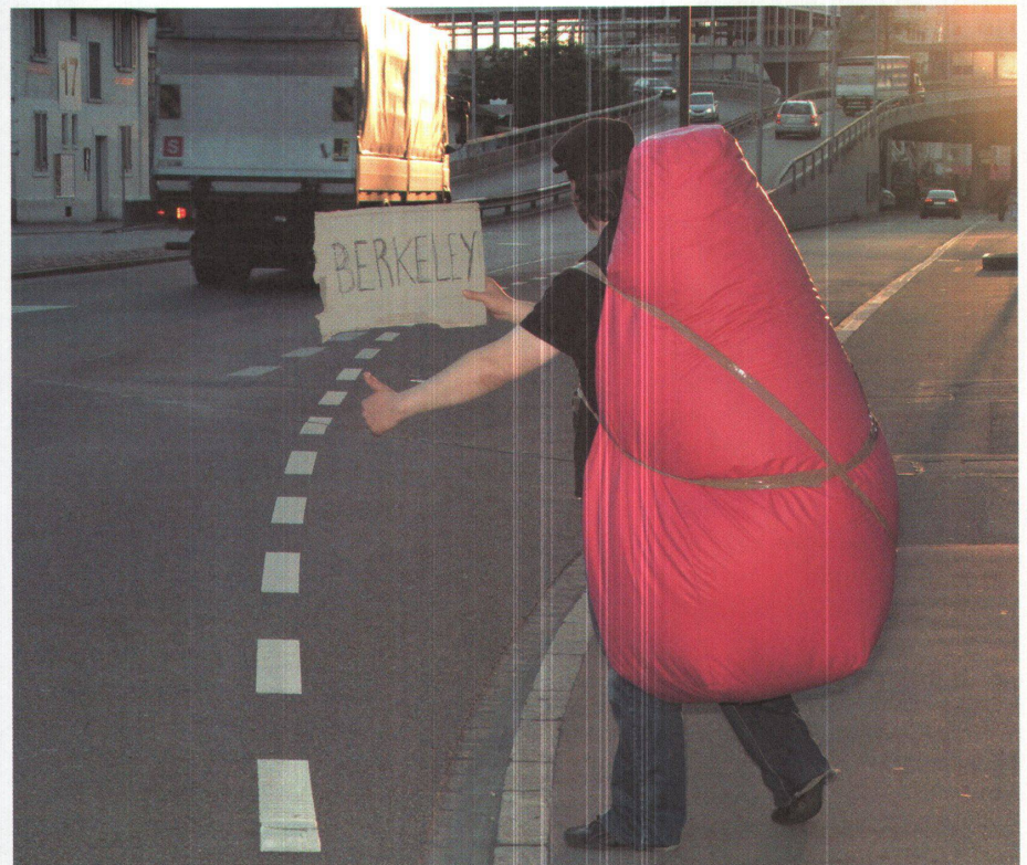
Ein Möbel zum Aufbrechen: Der Sitzsack «Sacco» feierte die Mobilität – der Ideen, der Möblierung, aber auch des Sitzens.

--> Bezug: Neumarkt 17, Zürich, www.neumarkt17.ch