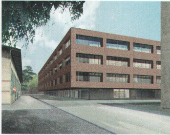
Von Roll-Campus, Bern