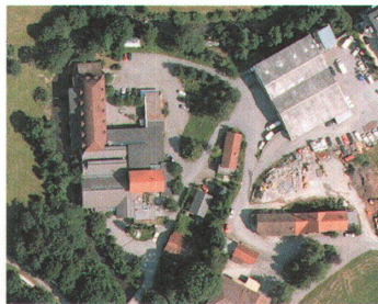
Fabrik am Rotbach, Bühler

Auf einem Teil des Von Roll-Areals im Länggassquartier bauten private Investoren Wohnungen. Drei bestehende Gewerbebauten werden weiter genutzt. Das übrige Areal will der Kanton Bern zum Campus für Uni und Pädagogische Hochschule umnutzen. 2004 fand dafür ein Architekturwettbewerb statt.