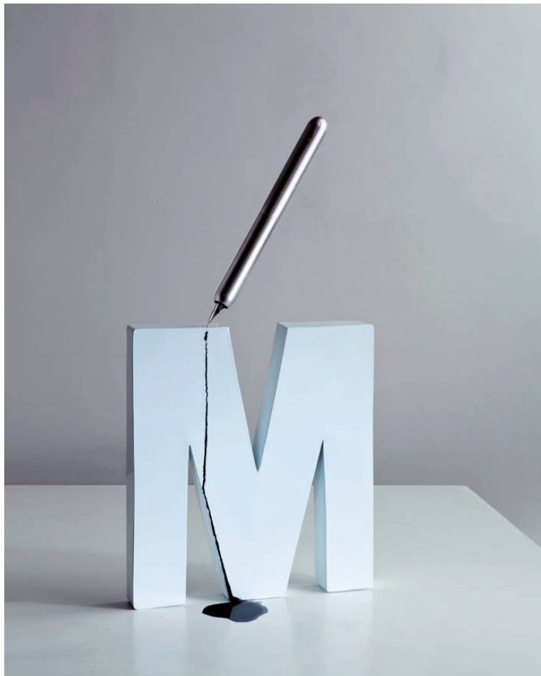
<Kleckern mit Stil.