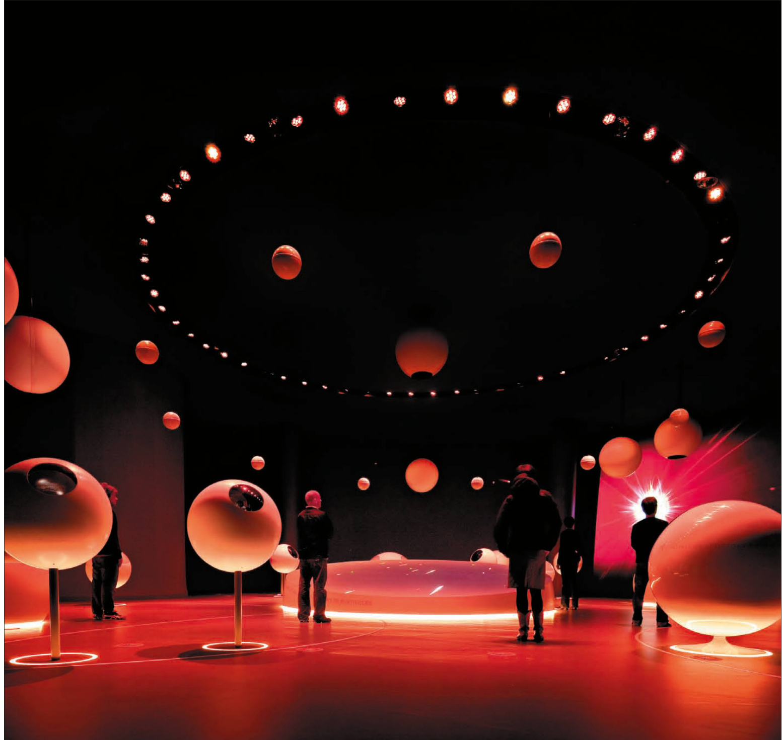
^Alles ist rund: Die Vitrinen, die Sitzgelegenheiten, die Stationen, auf denen Information versammelt wird, und sogar die Verhüllungen der Projektoren.