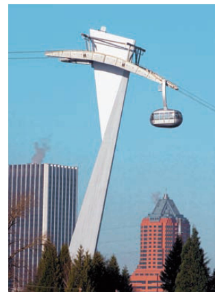
^ Verbindung zur Stadt: Luftseilbahn der Universitätsklinik in Portland, Ohio, vom Zürcher Büro agps.architecture: Selbst die Stützen sind entworfen.