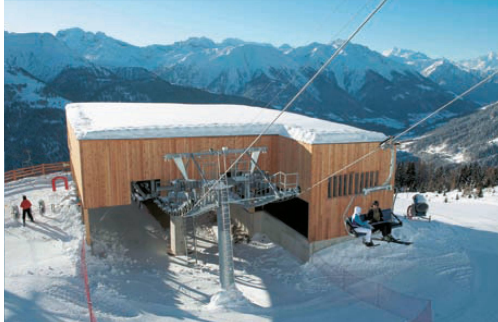
^ Chalet am Hang: die Mittelstation der Sesselbahn in Bellwald VS hat den Namen «Golden Rabbit».