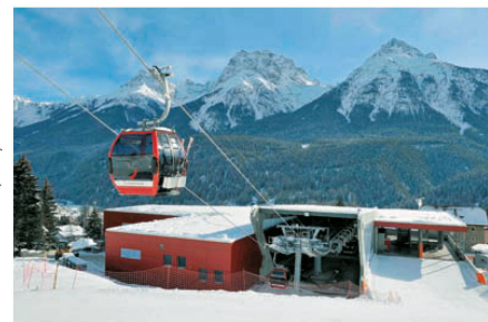
>Truckli im Tal: die Talstation der Gondelbahn Motta Naluns in Scuol GR.

Was sich Ende der Neunzigerjahre als Renaissance der Architektur beim Seilbahnbau ankündigte, war ein Strohfleuer. Das zeigt Garaventas Fotoalbum mit ihren Vorzeigeanlagen der letzten Jahre. Selbstverständlich gehören Bottas Cardada-Bauten dazu; wir sehen auch, dass der Maestro aus Lugano in Les Diablerets in hoher Höhe seine Handschrift hinterlassen hat; wir sehen auch die Carmenna-Stationen und wir verweilen fasziniert bei den Bildern aus Portland im US-Staat Ohio, wo eine Luftseilbahn >>