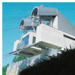
> Radarschirm am Berg: Bottas Bergstation in Orselina TI von 2000.