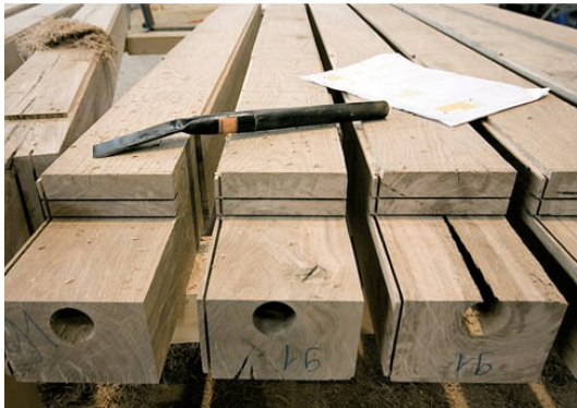
^Auch dünne Stämme werden zu Balken: Das kernlose Laubholz trocknet schneller und reisst weniger stark.