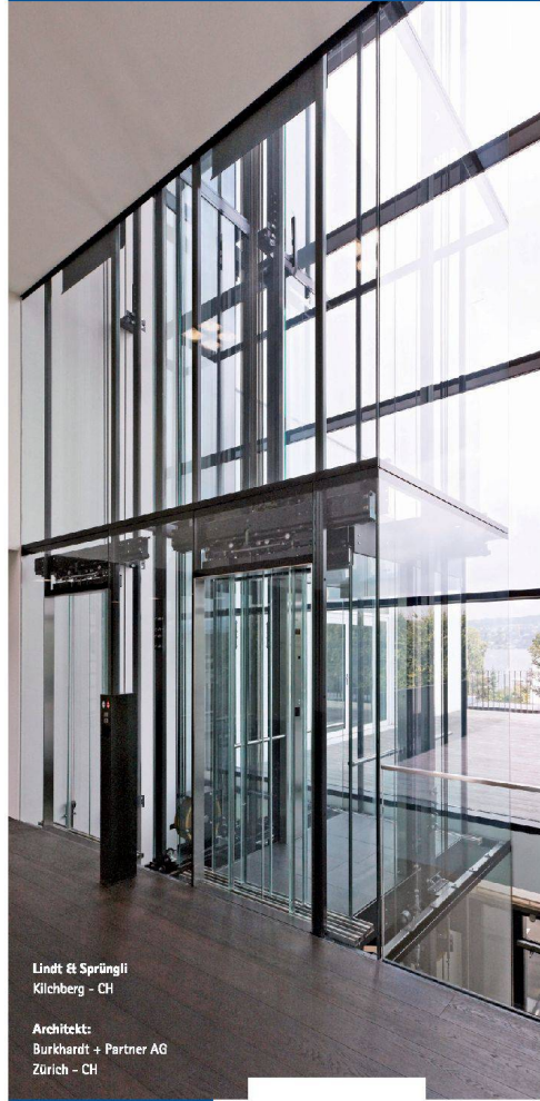
Lindt & Sprüngli Kilchberg - CH

Lifte bauen ist unsere Stärke. Das zeigt sich gerade bei architektonisch und konzeptionell anspruchsvollen Projekten. Wir setzen Ihre Vision um.