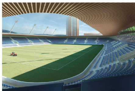
>52_Blick in das Fussballstadion «Swissporarena».