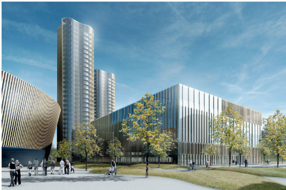
^50/51_Wohnhochhäuser und Sportzentrum, links angeschnitten das Fussballstadion.