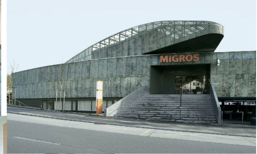
^58_ Migros Würzenbach.