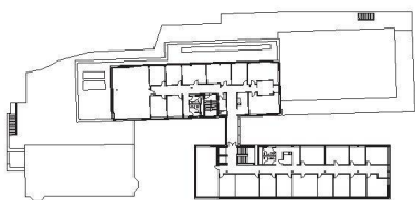
<62_ Grundriss Essex Chemie.