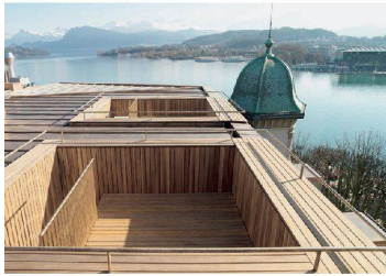
^56_ Wohnungen Genferhaus.