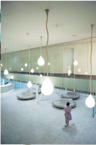
>57_ Hotel Astoria.