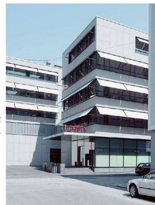
» 62_Hauptsitz Essex Chemie.

» Adresse: Schweizerhofquai 2 / Hertensteinstrasse 9 » Bauherrschaft: Hotel Schweizerhof, Genossenschaft Migros, Luzern » Architektur: Diener & Diener, Basel » Landschaftsarchitektur: Stefan Koepfli, Christoph Wey, Luzern » Auftragsart: Projektwettbewerb » Anlagekosten (BKP 1–9): CHF 70 Mio.