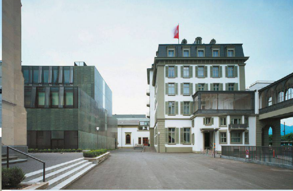
<63_ Hotel Schweizerhof.