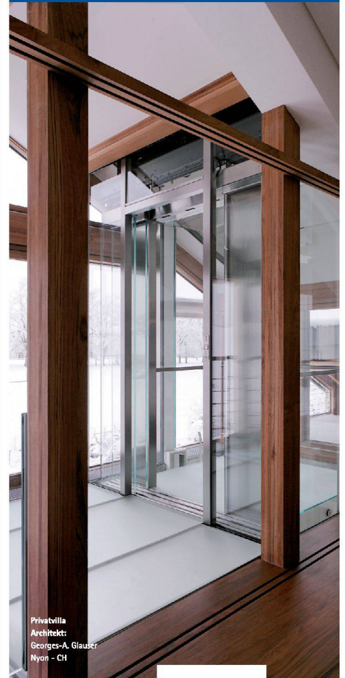
Privatvilla Architekt: Georges-A. Glauser Nyon - CH

Das zeigt sich gerade bei architektonisch und konzeptionell anspruchsvollen Projekten. Wir setzen Ihre Vision um.