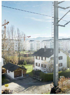
< Entwicklung Gartenstadt, Wohnquartier, «Agglo Obersee», Grossraum Zürich.

> Im Windschatten der Wahrnehmung und im Sichtfenster der S-Bahn.