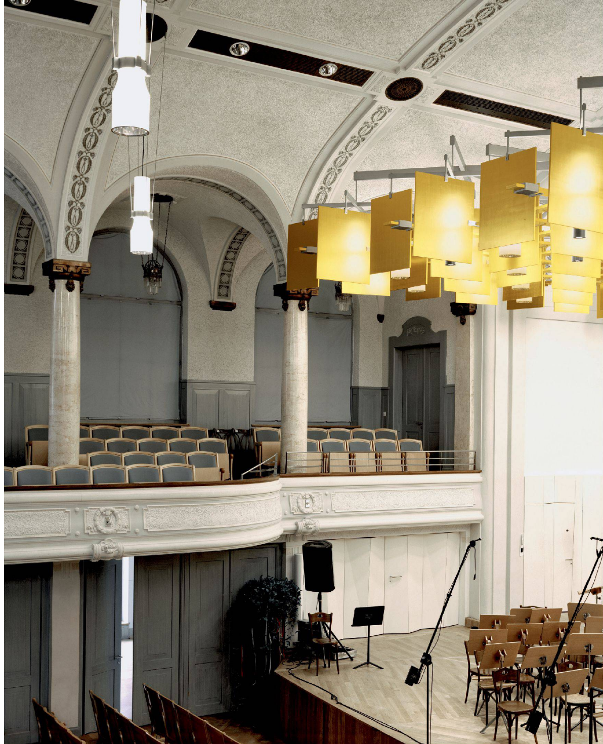
«Die «Klangwolke» an der Decke vergrößert die Raumbofläche, die Zickzackwände seitlich der Bühne verkleinern das Flatterecho.