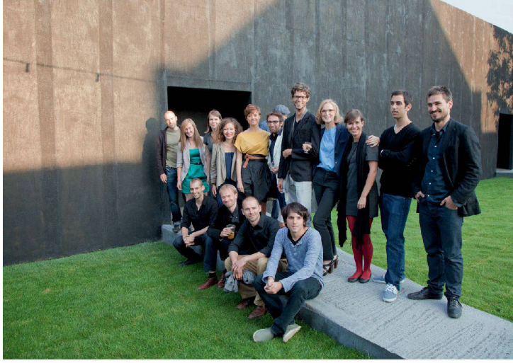
✓Sie alle arbeiten im Büro von Peter Zumthor.