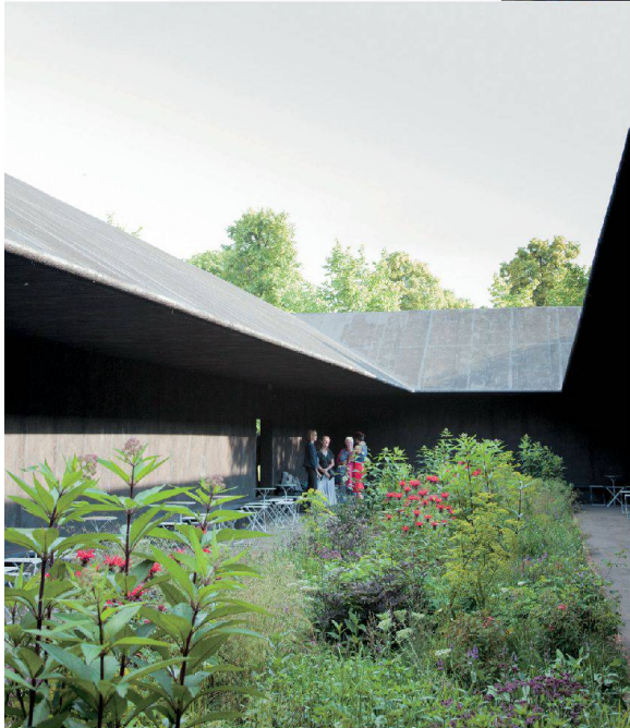
^Die Gartengestaltung stammt vom niederländischen Landschaftsarchitekten Piet Oudolf.