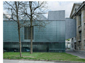
← Kunstmuseum, 1995.