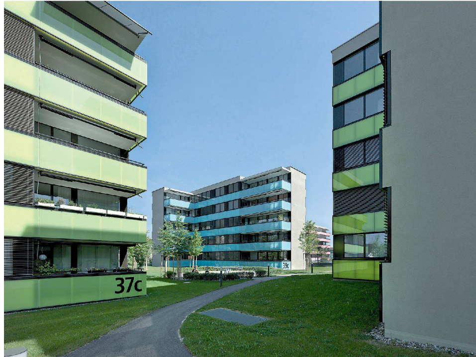
↘ Wohnüberbauung Talwiesen, 2010.