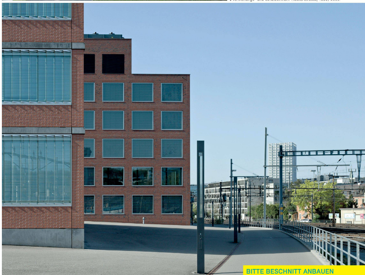
↘ Verwaltungs- und Schulzentrum Theaterstrasse, 1999/2005.