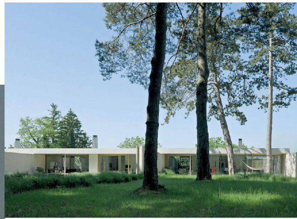
^ Wohnüberbauung Oberes Alpgut, 2008/2010.