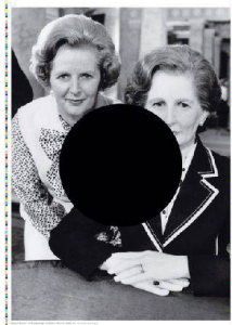
>Visueller Auftritt für das Schauspielhaus Zürich 2009/2010 von Cornel Windlin, ausgezeichnet mit dem Preis «Market» und 10 000 Franken.