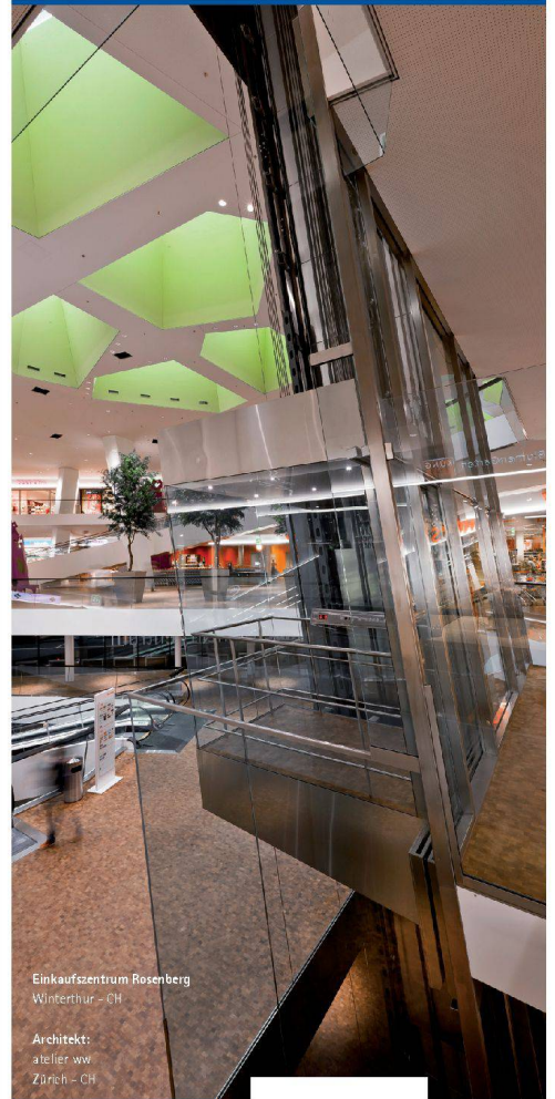
Einkaufszentrum Rosenberg Winterthur - CH

Das zeigt sich gerade bei architektonisch und konzeptionell anspruchsvollen Projekten. Wir setzen Ihre Vision um.