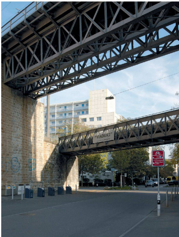
^Über den hohen Viadukt brausen die Züge, die untere Brücke dient dem Fussgänger- und Veloverkehr.

> Bauherrschaft: Tiefbauamt der Stadt Zürich (Lettenviadukt); Grün Stadt Zürich (Josefswiese) > Landschaftsarchitektur: Schweingruber Zulauf, Zürich (Lettenviadukt und Josefswiese) > Architektur Viaduktbögen: EM2N, Zürich > Kosten: CHF 4,5 Mio. (Lettenviadukt); CHF 1,5 Mio. (Josefswiese)