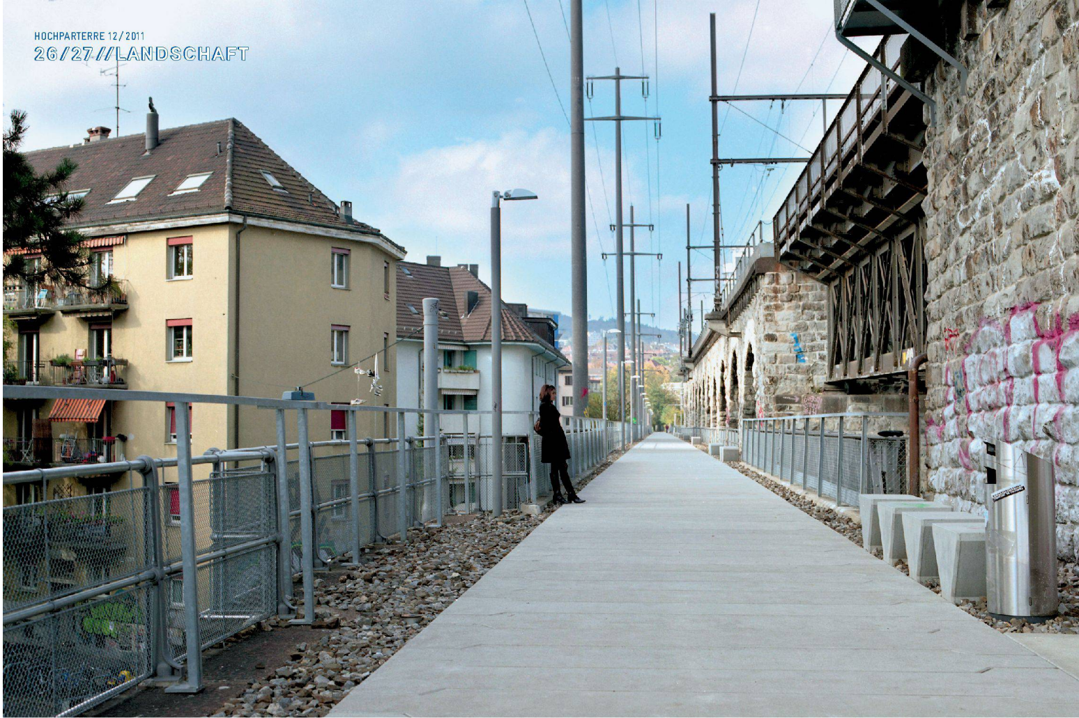
^Die Betonelemente erinnern entfernt an Verbundsteine der Siebzigerjahre, das Geländer ist eine pragmatische Ergänzung des Bestands.