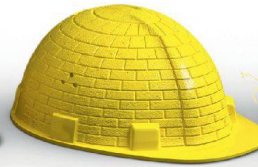
Mauerwerk & Bauteile