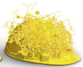
Nachhaltigkeit & Innovation

Auf die Erstellung hochkomplexer Klinker- und Sichtsteinfassaden haben wir unser Fundament gebaut. Dass wir visionär denken und entsprechend planen und realisieren, beweisen wir täglich in sämtlichen Bereichen unserer Geschäftsfelder. Wir schaffen Mehrwert, mit System am Bau: www.keller-ziegeleien.ch