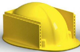
Fassaden & Boden