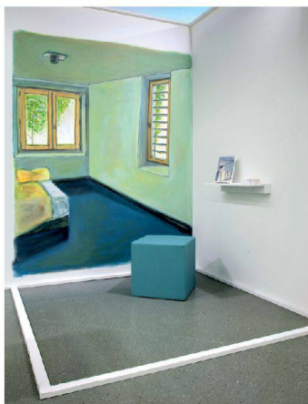
◀Abschlussarbeit von Pirmin Beeler: Illustration Fiction, 2011.