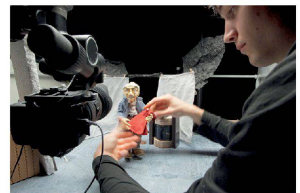
^Diplomfilmprojekt von Marius Portmann: Animation, 2011.