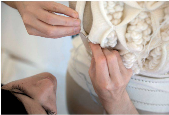
◀Stricken, aus dem Kurs Textildesign, 2011.