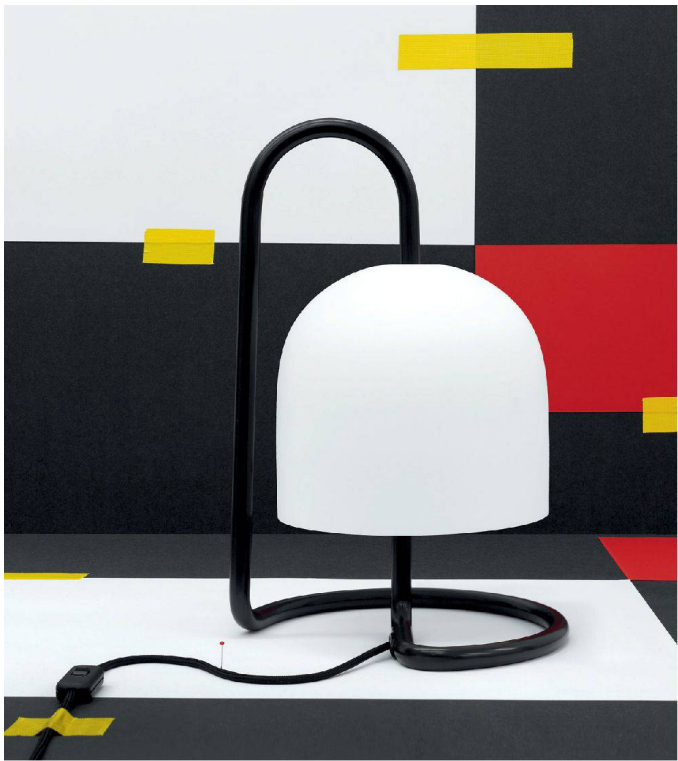
«Der abstrakte Vogelstrauss als formschöne Leuchte «Mon».