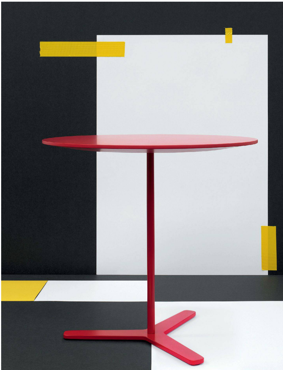
«Klein, aber nicht unauffällig: der Beistelltisch «Tre».