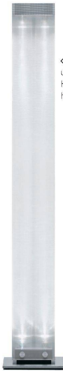
<<Twilight» von Belux, ursprünglich eine Halogenleuchte, gibts heute auch mit LEDs.