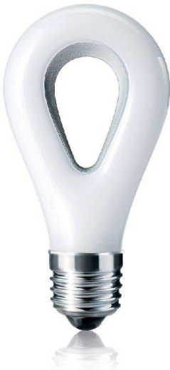
«Bulb» mit herkömmlichem Gewinde und kühlender Öffnung, gestaltet von der Designagentur Process.

» bisher ein Leuchtmittel beim Grossverteiler nachkaufen, sondern müssen beim Hersteller anfragen. Ersatz sei kaum nötig, denn die Lebensdauer betrage mit 30 000 und mehr Stunden ein halbes Leben – so versprechen es die Laborwerte. Erfahrungswerte liegen allerdings noch nicht vor. Dennoch kann man Leuchtmittel in traditionellen Formen und Fassungen kaufen, die mit LEDs bestückt sind. Diese nennt man Retrofits. Über Sinn und Zweck dieser Lampen scheiden sich die Geister. Kritiker bemängeln daran, dass LEDs nur langlebig sind, wenn die Abwärme abgeführt werden kann. Eine herkömmliche Leuchte ist aber darauf nicht ausgerichtet. Auch fehlen Standards, die als Richtlinien dienen könnten.