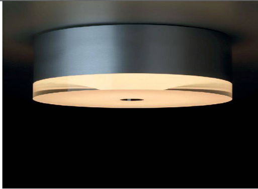
^Die Deckenleuchte «HiLight» hat Altime Licht zusammen mit Neuco fürs «Dolder Grand» mit LEDs ausgerüstet.