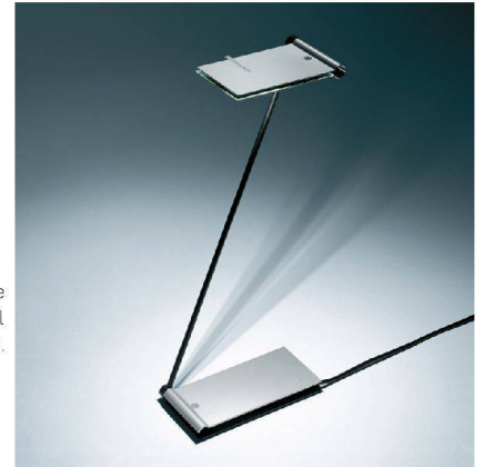
»«Zett», das erste einheimische LED-Modell von Baltensweiler, 2003.