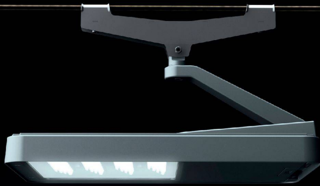
^Beleuchtet die Winterthurer Stadthausstrassen: Seilleuchte «Metro» von Burri Public Elements.