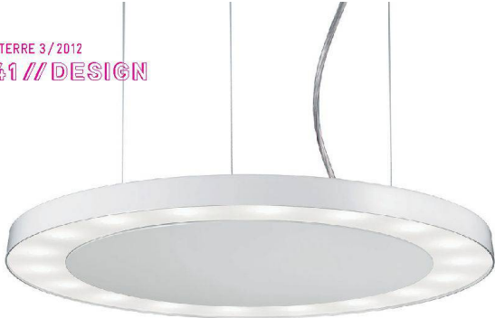
^«Flisc» der Firma Ribag ist ein Zwitter aus FL und LEDs.