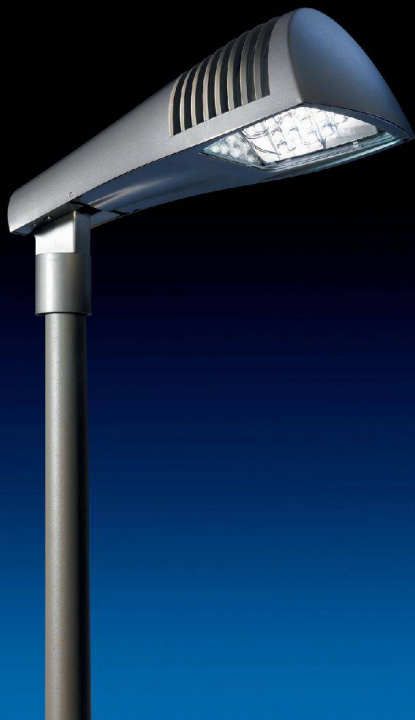
^«Archilede» spendet Licht in den Strassen von Igis, zusammen mit «Delphi», beide von iGuzzini.