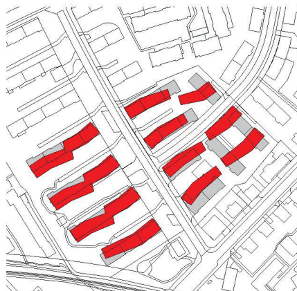
^2_Wasserschöpfli: ähnliche Struktur, aber höher.