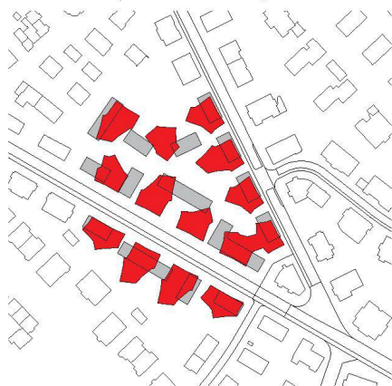
^4_Toblerstrasse: Kammerungen statt Abstandsgrün.