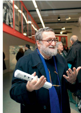
✓Gehört zu den junggebliebenen Altmeistern: Bruno Monguzzi.